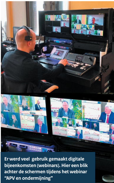
Er werd veel gebruik gemaakt digitale bijeenkomsten (webinars). Hier een blik achter de schermen tijdens het webinar "APV en ondernijning"