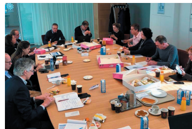
Teamvergadering van het ATO (februari 2019)