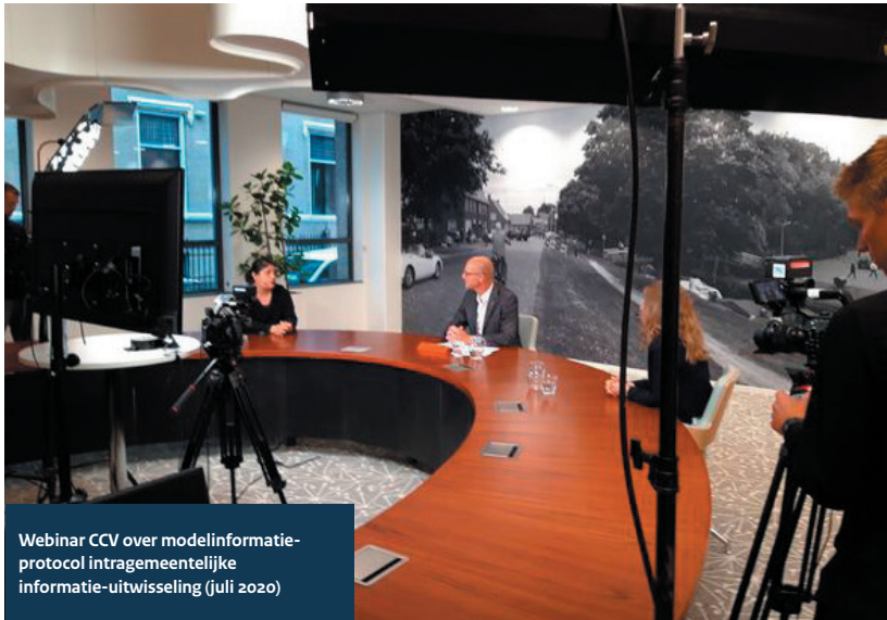
Webinar CCV over modelinformatie-protocol intragemeentelijke informatie-uitwisseling (juli 2020)