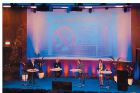
Webinar Damocles (juli 2020)