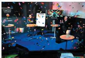
Lancering van het KPO tijdens de landelijke RIEC-LIEC-dag (november 2020)