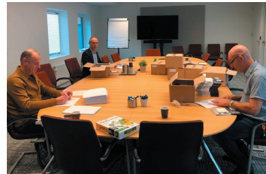
Verzending van de ATO-uitgave "Mee(r) doen met Damocles" (oktober 2020)