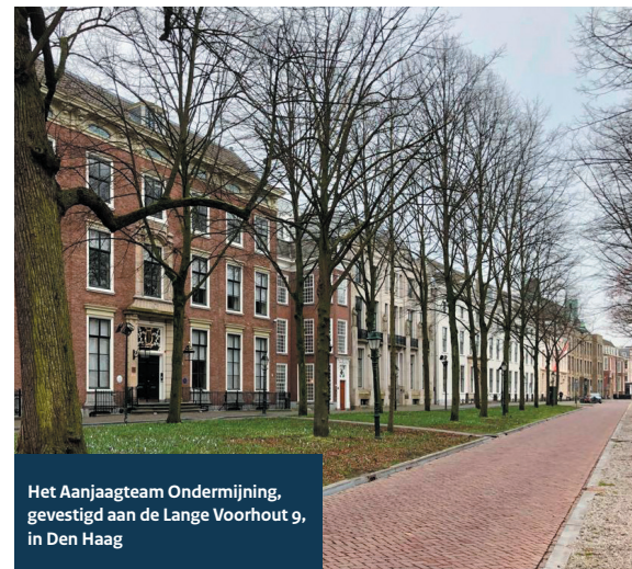
Het Aanjaagteam Ondermijning, gevestigd aan de Lange Voorhout 9, in Den Haag