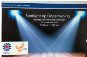
Tweede conferentie (webinar) Spotlight op Ondernijming: "Preventie en repressie verbinden" (november 2020)