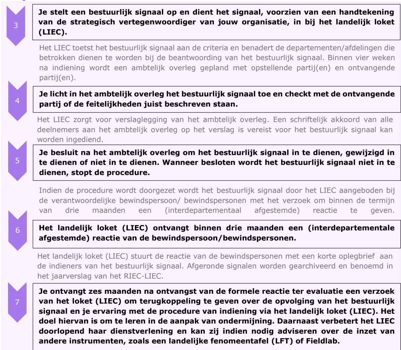
Afbeelding 1: Procedure bestuurlijk signaal

De organisatie wordt geadviseerd om een bestuurlijk signaal op te stellen en in te dienen. Je ontvangt van het LIEC deze informatiebrochure en de eisen voor het opstellen van een bestuurlijk signaal.